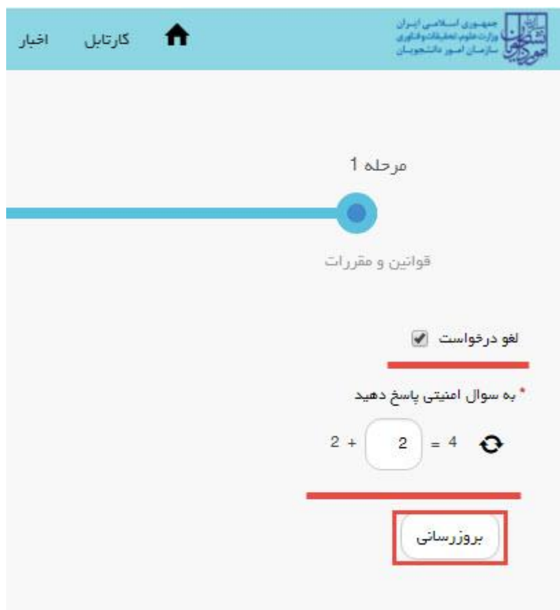
تصویر ۱۱-لغو درخواست

همچنین می توانید با انتخاب گزینه لغو درخواست نسبت به لغو فرآیند اقدام نمایید.(تصویر ۱۱)