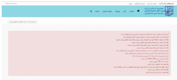
تصویر ۵-نمایش اخطار در صورت وارد نکردن فیلد های اجباری

در صورت خالی بودن فیلد های اجباری با پیغامی در بالای صفحه مواجه می شوید که در این حالت سیستم از ثبت درخواست جلوگیری می کند.(تصویر ۵)