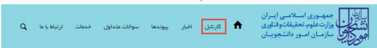
تصویر ۸- کارتابل شخصی

با دریافت پیغام جهت مراجعه به پورتال، برای مشاهده وضعیت خود اقدام نمایید. از طریق پورتال سازمان امور دانشجویان سربرگ کارتابل را انتخاب نمایید. (تصویر ۸)