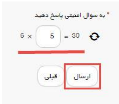
تصویر ۴-سوال امنیتی

سپس به سوال امنیتی پاسخ داده و بر روی دکمه ارسال کلیک کنید.(تصویر ۴)